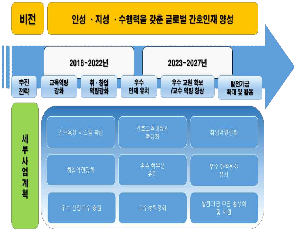
그림 7. 간호대학 성장기 발전계획(2018-2027년)