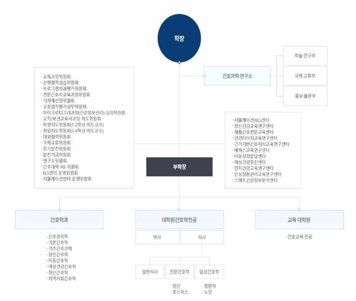
그림 2. 간호대학 조직도