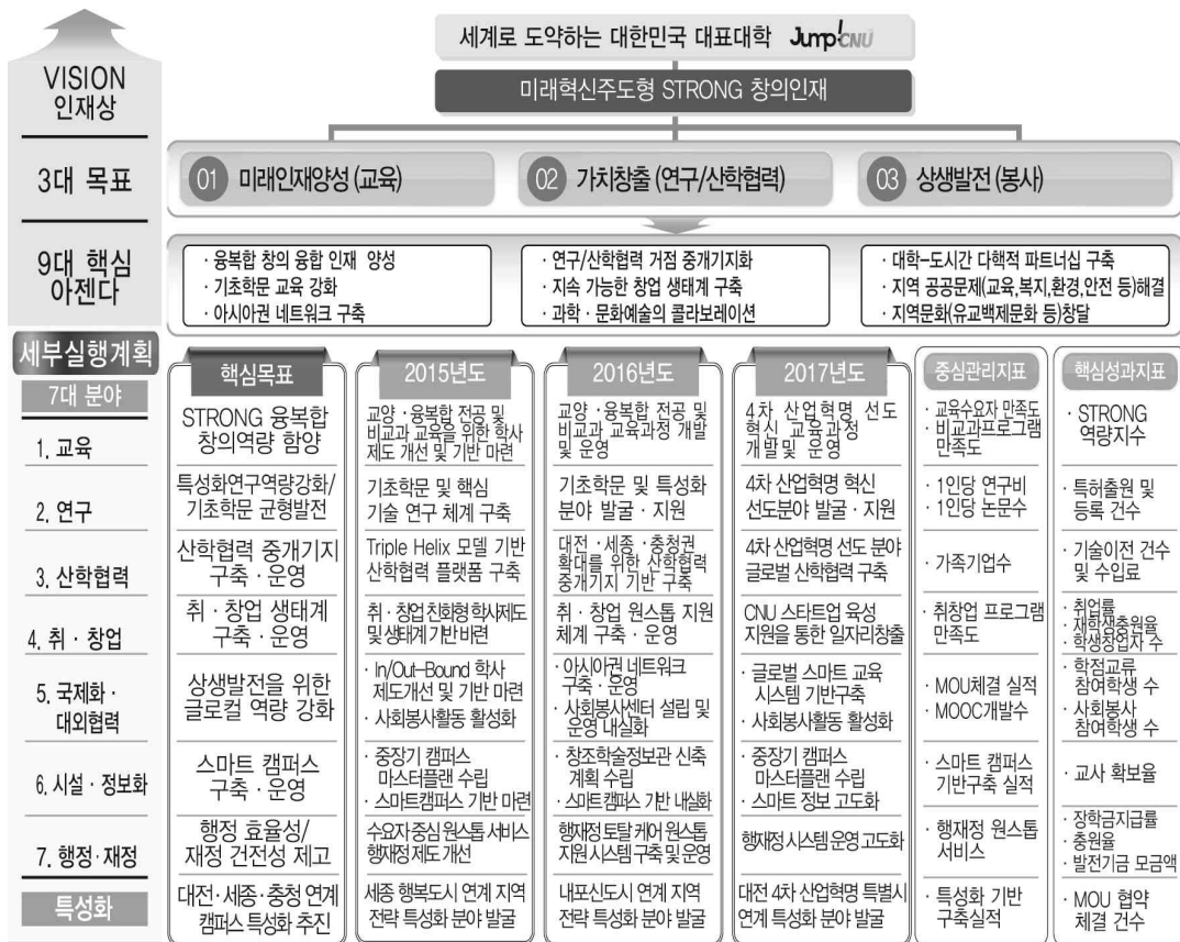
그림 4. 충남대학교의 비전과 목표 개념도