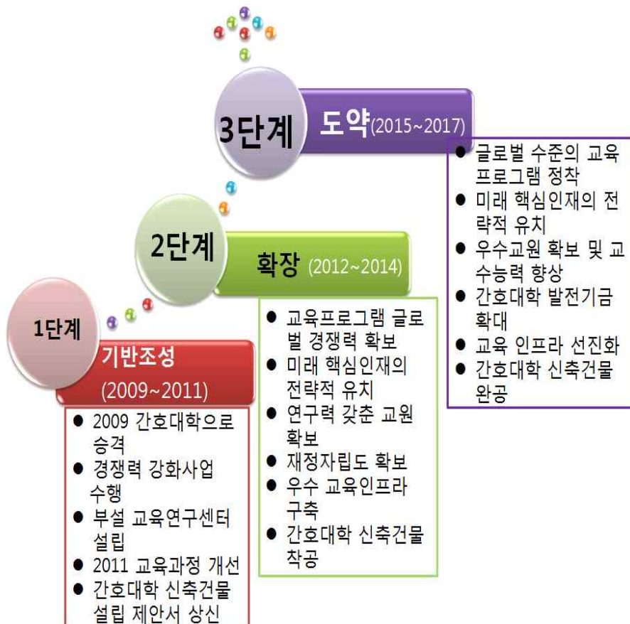
그림 6. 간호대학 발전계획 (2009-2017)