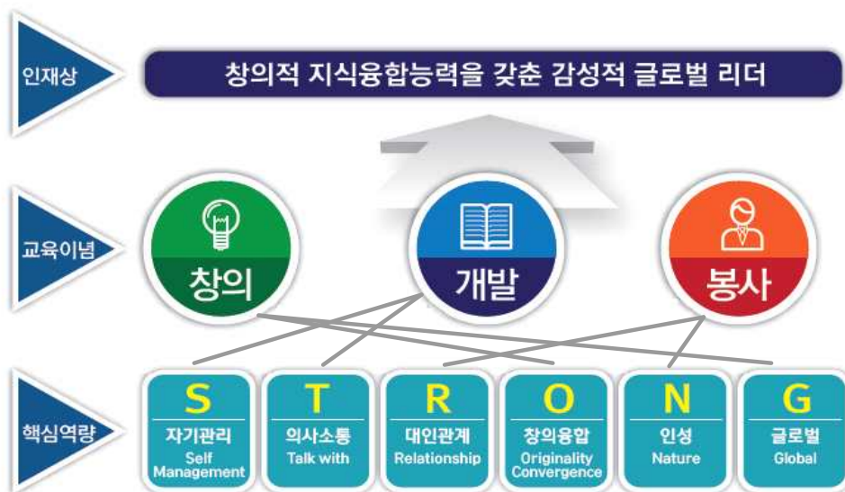
그림 5. 충남대학교 인재상