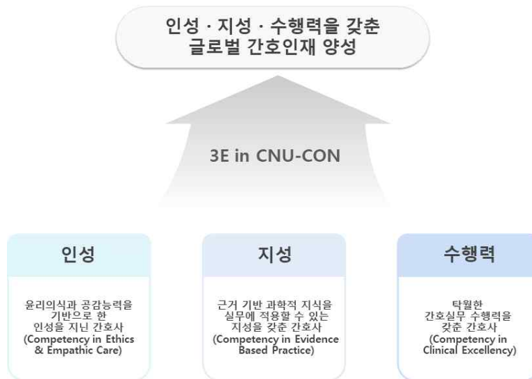
그림 1. 간호대학의 비전